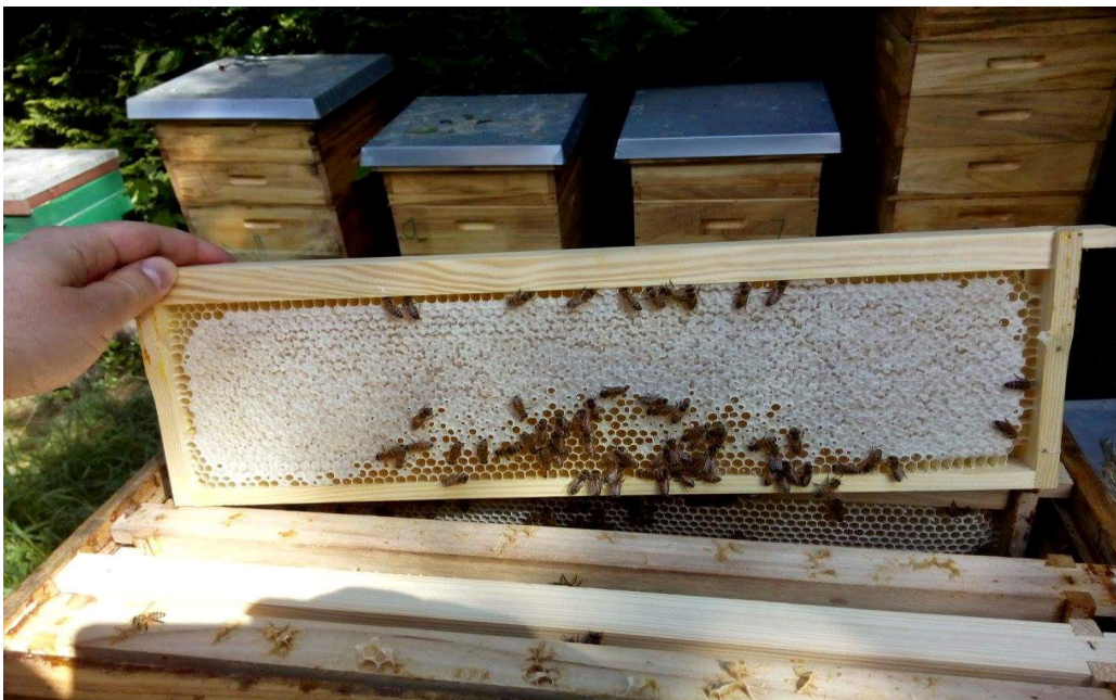
Bienenstand in Sinzig